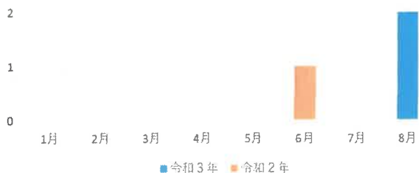
令和3年・令和2年 月別子どもの水難事故死者数