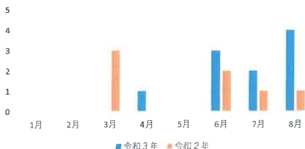
月別子どもの水難事故発生件数