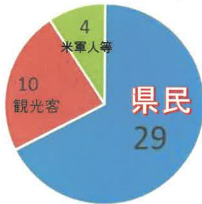
水難事故死者の特徴 (罹災者別、令和2年)