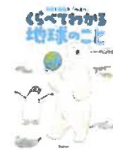
北極と南極の「へえ～」 くらべてわかる地球のこと