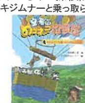
空飛ぶのらネコ探検隊 ~キジムナーと乗っ取られたのら号~