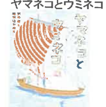
ヤマネコとウミネコ