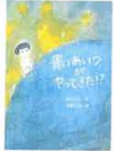
青いあいつがやってきた!?