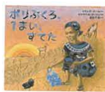
ポリぶくろ、1まい、すてた