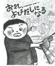
おれ、よびだしになる