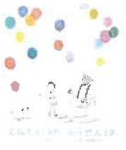
とんでいったふうせんは