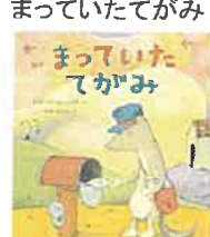
まっていたてがみ