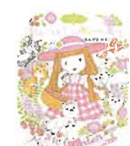
100年ハチミツのあべこべ魔法