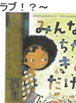
みんなとちがうきみだけ