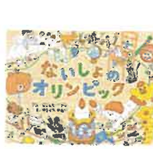
ないしょのオリンピック