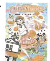
妖精のカレーパン