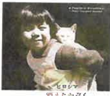
ヒロシマ 消えたかぞく