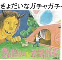
きょだいながチャガチャ