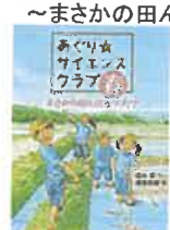
あぐり☆サイエンスクラブ: 春 ~まさかの田んぼクラブ!??~