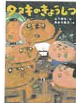
タヌキのきょうしつ