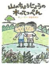
山のちようじょうの木のでっぺん