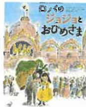
ロバのジョジョとおひめさま