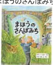
まほうのさんぼみち