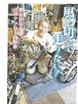
風を切って走りたい! 夢をかなえるバリアフリー自転車