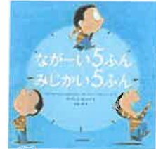
ながーい5ふん みじかい5ふん