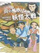
炎の風吹け妖怪大戦 妖怪道中三国志